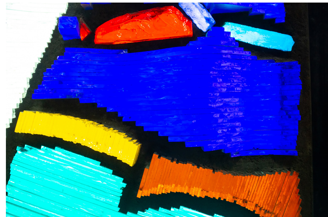
Н. М. Вдовкин. Витраж «Амур». Фрагмент. 1984. Стекло, лак, металл. 390×200 Музей истории Дальнего Востока имени В. К. Арсеньева (Владивосток)

Это решение напоминает о размышлениях С.А. Павловского – о развитии творческой личности, о художнике-открывателе и художнике-изобретателе: «Может ли художник создавать нечто новое, не опираясь на свой чувственный опыт или на непосредственное ощущение природы? Могут ли новые формы возникать под рукой художника подобно кристаллам, подчиняясь только внутренней логике своего развития и закономерностям развития художественной формы, или они нуждаются в какой-то еще среде?.. И если открыватель – это тот, кто ищет в природе ценности и воспроизводит объекты природы, то изобретатель на осно-