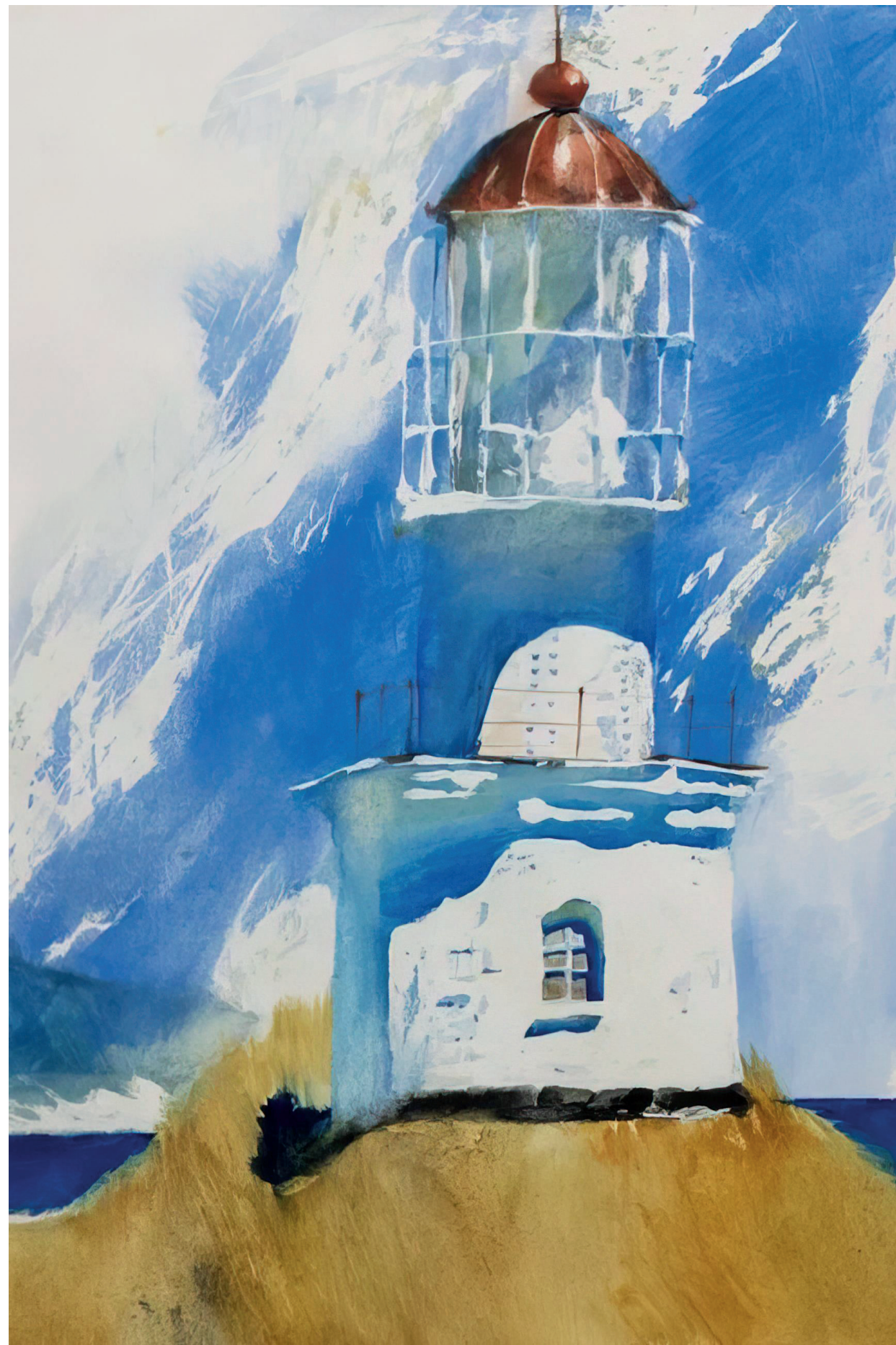
С. М. Черкасов. Маяк Поворотный. Иллюстрация к настенному календарю из серии «Маяки залива Петра Великого». 1990–1991. Бумага, акварель. 37×28,5 Музей-заповедник истории Дальнего Востока имени В. К. Арсеньева