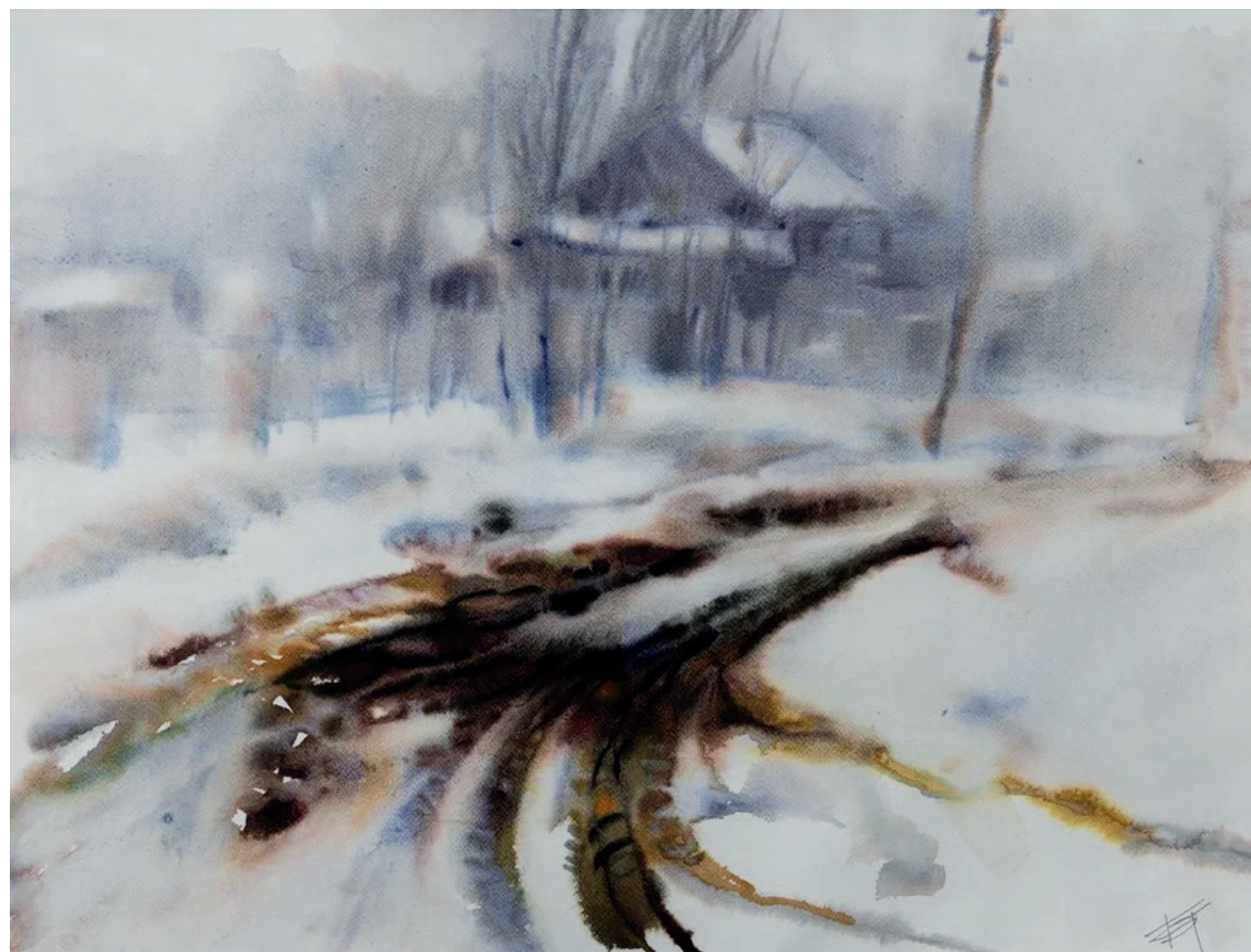
Б. В. Тамулевич. Дорога в Рождественке. 2007. Бумага, акварель. 66,5×81 Музей-заповедник истории Дальнего Востока имени В. К. Арсеньева

Если во второй половине XIX – начале XX в. художников на Дальнем Востоке можно было встретить в первую очередь в составе морской экспедиции в качестве рисовальщиков, от которых не ждали образности, напротив, требовалась точность отображения ландшафта и береговой черты (корабельный художник руководствовался четкими инструкциями), то в XX в. дальневосточные земли были по-настоящему воспеты в живописи и графике. Художники теперь не «снимают виды» – не в этом их задача, а скорее, стремятся уйти от фотографического воспроизведения ме-