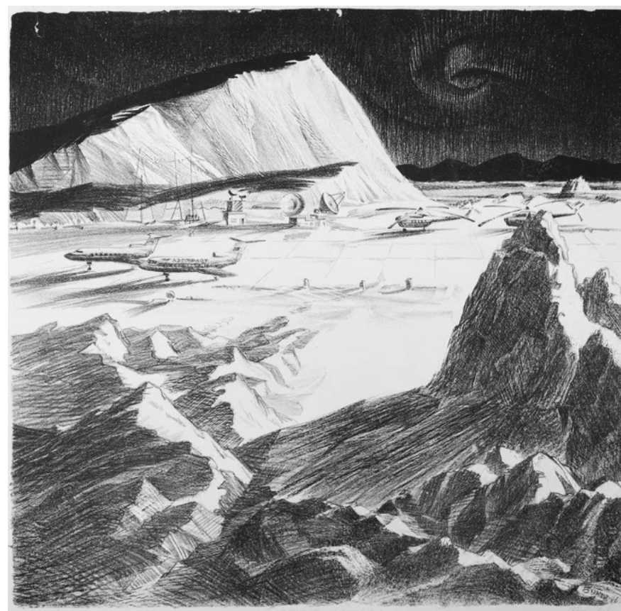
V. P. Bykov. Аэропорт на Чукотке. 1986. Бумага, автолитография. 72,5×75 Музей-заповедник истории Дальнего Востока имени В. К. Арсеньева