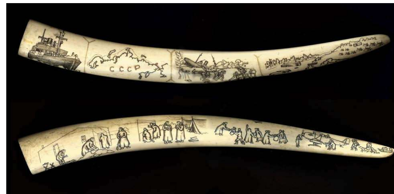
Rescue of the Chelyuskinites. Uelen, 1930. Tusk, engraving. 61×6×3.5 State United Museum-Reserve of the History of the Far East named after V.K. Arsenyev (Vladivostok)