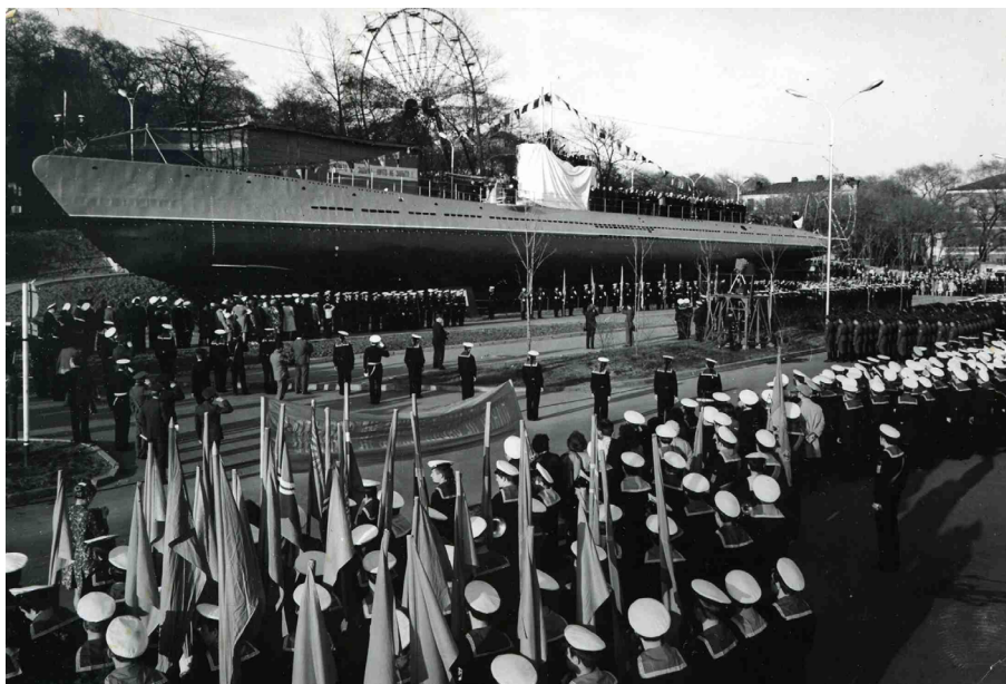
Ил. 2. Открытие мемориального комплекса «Подводная лодка С-56». Автор: Муравин Ю.Я. Владивосток. 9 мая 1975 г.

ном пространстве осуществлялась с помощью фотографий из фондов нашего музея. Большую часть музейной коллекции составляют снимки, выполненные местными фотокорреспондентами в советское время (Н.А. Назаровым, Ю.Я. Муравиным, Б.П. Подальевым, Г.В. Димовым, И.С. Гусевым, А.А. Чичилиным и др.). Как правило, эти фотографии были сделаны во время открытия памятников, празднования Дня Победы 9 мая, митингов и других массовых мероприятий и носили репортажный характер (ил. 2, 3). На таких фотографиях мемориалы являются не единственными, а иногда и не главными объектами изображения, но их роль как мест памяти подчеркнута достаточно ярко.