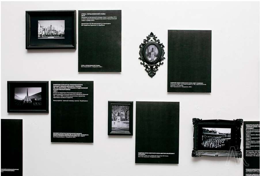
Ил. 6. Пример оформления фотографий с видами памятных мест в экспозиции «Память о войне: предметный разговор»

В процессе составления полного перечня городских воинских мемориалов выяснилось, что в разных источниках сведения об интересующих нас объектах нередко разнятся. В первую очередь, это касается точного географического расположения памятников, находящихся в заброшенных и труднодоступных районах г. Владивостока и о. Русский. Для уточнения этой информации музейными сотрудниками был совершен ряд исследовательских экспедиций. Собранные ими материалы планировалось представить в экспозиции на большой карте с обозначением расположе-