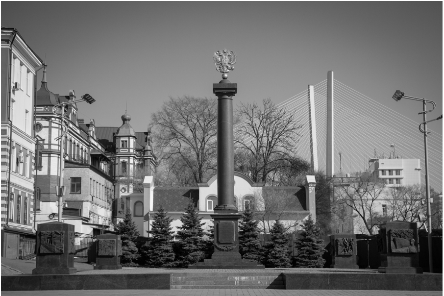
Ил. 5. Стела «Город воинской славы». Автор: Кирсанова Е.С. Владивосток. 2020 г.

в местах с ограниченным доступом — на территориях предприятий и военных частей, или в труднодоступной и удаленной местности о. Русский.