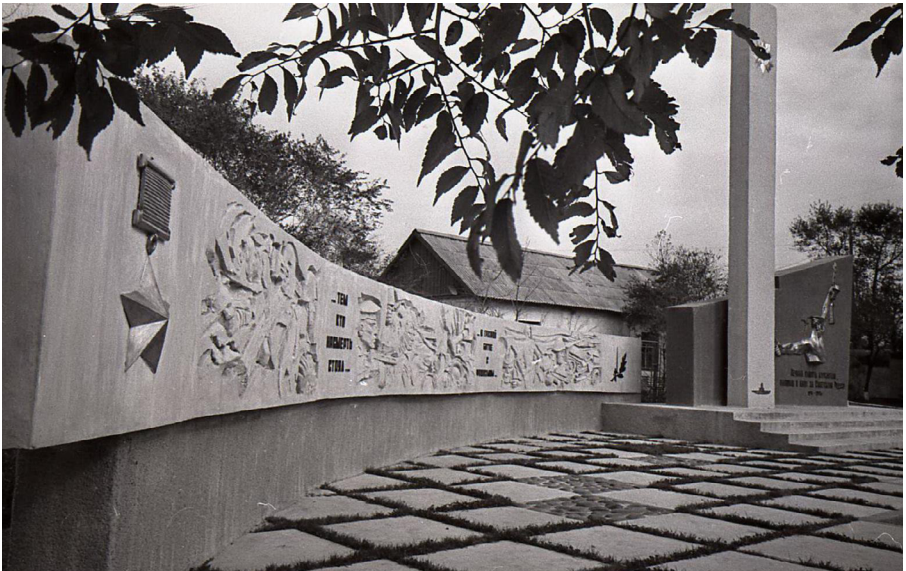
Ил. 4. Памятник курсантам учебного отряда Тихоокеанского флота, павшим в сражениях Великой Отечественной войны. Автор: Назаров Н.А. Владивосток. 1972 г.

бражения некоторых городских военных мемориалов. Впоследствии эти снимки дополнили научно-вспомогательный фонд музея.