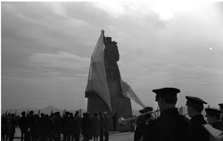
Ил. 3. Открытие памятника морякам торгового флота, погибшим в годы Великой Отечественной войны. Автор: Назаров Н.А. Владивосток. 5 ноября 1967 г.

К другой категории изображений относятся снимки, где воинские мемориалы являются главным объектом интереса фотографа, и он уделяет большое внимание деталям памятников или тому, как они вписаны в городскую среду. Стоит отметить три крупные серии таких работ, снимки из которых вошли в экспозицию. Это фотографии, выполненные Владивостокскими фотографами: Н.А. Назаровым (1972), Ю.Е. Шубиным (2000), к 55-му юбилею Победы, и Е.С. Кирсановой (2020) (ил. 4, 5). Последняя серия фотографий была сделана автором специально для выставки «Память о войне: предметный разговор», поскольку при ее подготовке выяснилось, что в музейной коллекции отсутствуют изо-