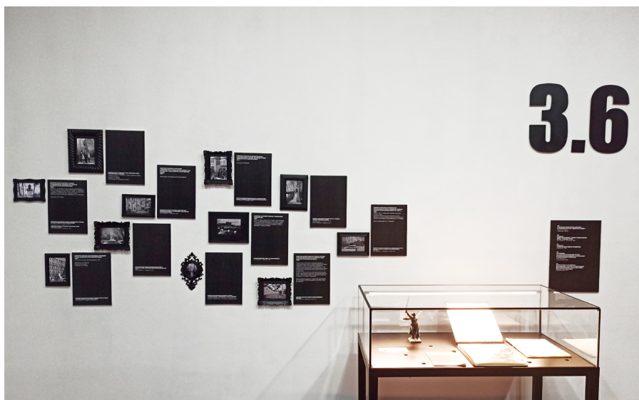
Ил. 7. Интерактивная карта с обозначением мемориалов в память о событиях и участниках Великой Отечественной и Второй мировой войн, расположенных на территории г. Владивостока и о. Русский

Тем не менее, проделанная работа нашла свое отражение на сайте музея в виде интерактивной карты с обозначением всех городских мемориалов в память об участниках Великой Отечественной и Второй мировой войн (ил. 7) 1 . Карта позволяет интересующимся познакомиться с ними самостоятельно, узнать точное местоположение и при желании посетить их. Все указанные на карте объекты снабжены краткой информацией (даты откры-