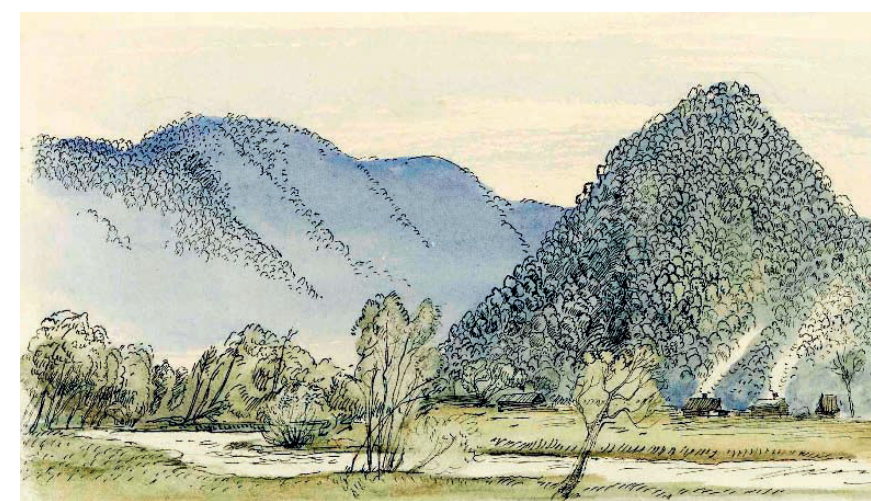
С. М. Черкасов. Иллюстрация к книге В.К. Арсеньева «По Уссурийскому краю». Разворот полуполосный. 1987. Бумага, акварель. 17×25 Музей-заповедник истории Дальнего Востока