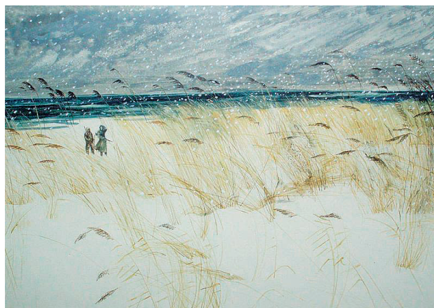
С. М. Черкасов. Иллюстрация к книге В.К. Арсеньева «По Уссурийскому краю». Разворот полосный. 1987. Бумага, акварель. 28×20 Музей-заповедник истории Дальнего Востока