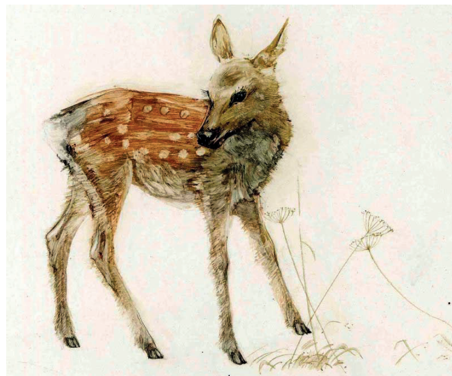
S. M. Cherkasov. Illustration to the book by V.K. Arsenyeva "Through the Ussuri region". 1987. Paper, watercolor. 17x25. Museum-Reserve of the History of the Far East

В частности, основной творческой площадкой в 1960–1980-е гг. являлось Дальневосточное книжное издательство. В число наиболее популярных изданий вошли книги о животном и растительном мире дальневосточной тайги, об особенностях жизни обитателей тайги и океана.