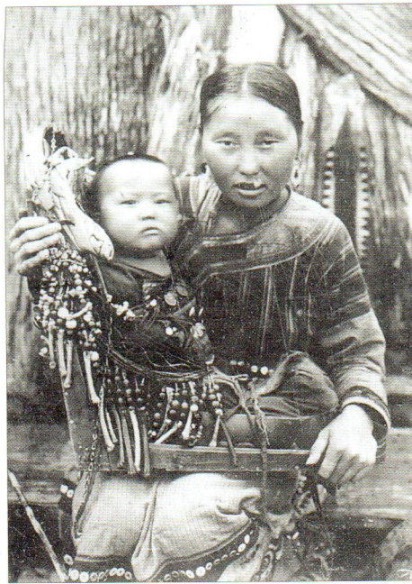
Мальчик (бата) в люльке с матерью. Стойбище удэгейцев Исими на реке Самарге.

Девочки нанайцев, удэгейцев и орочей учились тому, что полагалось уметь женщине — матери и хозяйке. Уже в 7–8 лет они участвовали в ведении домашнего хозяйства: шили одежду, готовили пищу, чистили рыбу, обрабатывали шкуры, мяли кожу, собирали корни и ягоды. Их орудия труда соответствовали самим труженицам — были маленькими, игрушечными. В фондах музея хранятся детская кожаная мялка, шило и нож для вырезания ор-