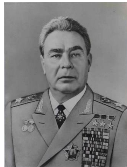
Л. И. Брежнев, маршал Советского Союза, кавалер ордена «Победа». СССР, 1978 г.