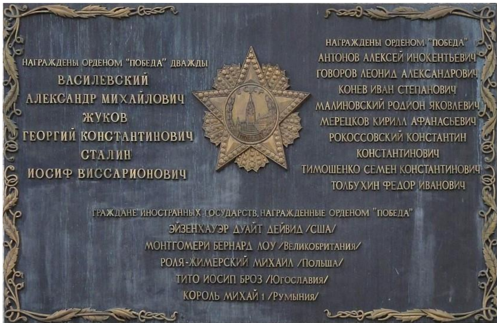
Мемориальная доска в Кремле с именами кавалеров ордена «Победа»

В 1945 г. награждение орденом «Победа» было прекращено (за исключением впоследствии отмененного награждения Л.И. Брежнева). В настоящее время эта награда отсутствует в системе государственных наград Российской Федерации. Тем не менее, 9 мая 2000 г. в Московском Кремле была открыта Мемориальная доска с именами всех кавалеров ордена «Победа».