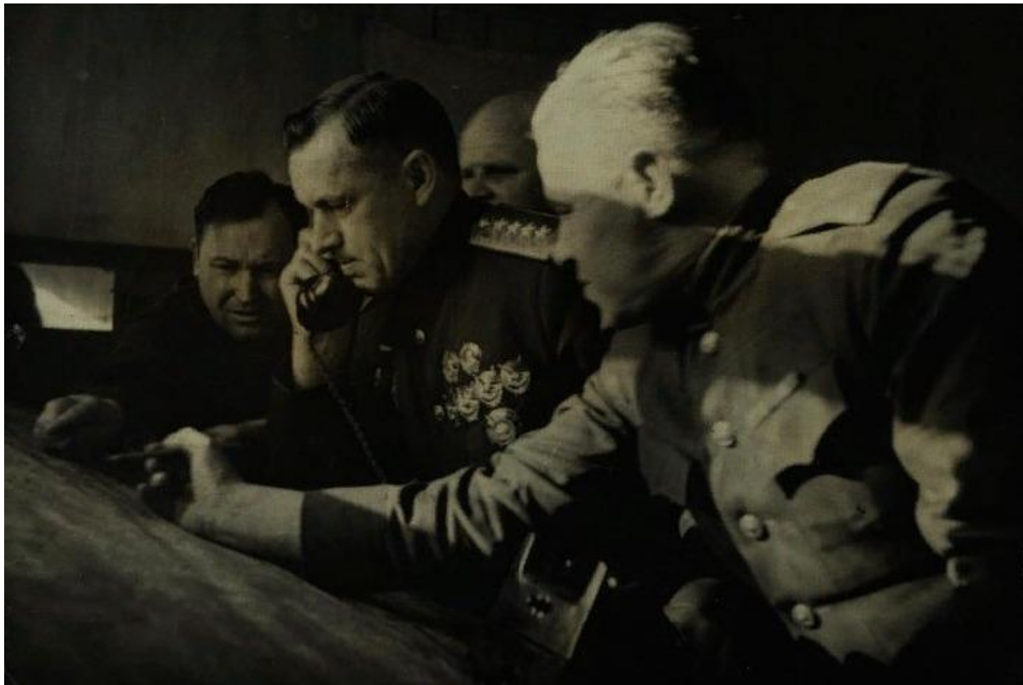
Командующий 1-м Белорусским фронтом К.К. Рокоссовский (в центре) в штабе фронта за оперативным руководством боевой операцией. 1944 г.

В этих боях блестяще проявила себя плеяда талантливых советских полководцев. Поэтому было решено учредить особый орден для награждения высшего командного состава Красной Армии, под чьим руководством были разработаны и осуществлены операции советских войск по разгрому группировок противника. Кроме того, создание ордена было актом, в значительной степени символическим. Бои еще шли на советской территории, к победе лежал долгий путь, и появление такого ордена демонстрировало уверенность в этой победе.