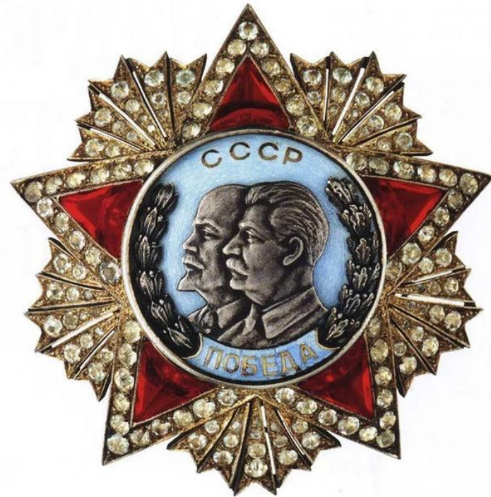
Черновые варианты ордена «Победа». Художник А.И. Кузнецов (ФГБУ «ЦМВС РФ», филиал «Музей истории военной формы одежды»)