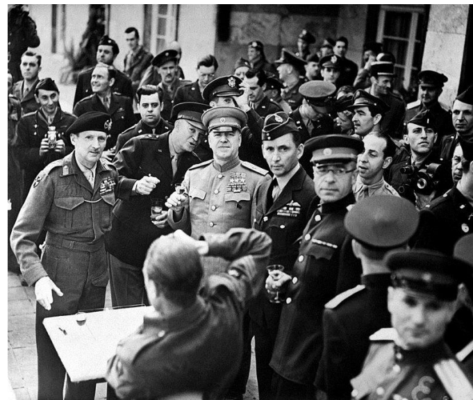
Маршал Жуков после награждения орденом «Победы» Монтгомери и Эйзенхауэра