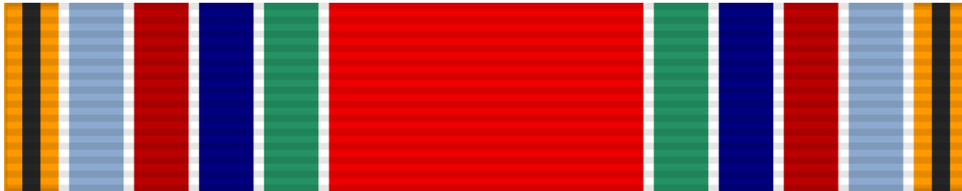
Лента ордена «Победа»

Следует отметить, что впервые за годы войны в наградной практике полководческая награда была учреждена без описания орденской ленты для ношения на планке без самого ордена. Только через полгода после его учреждения стала разрабатываться лента к ордену «Победа». Были разработаны новые оригинальные образцы, которые значительно отличались от привычного вида отечественных лент. После поисков и опробования различных вариантов планок и цветовой гаммы, Сталин, подправив некоторые образцы, в конце июля 1944 г. одобрил ленту ордена «Победа». Через три недели, 18 августа 1944 г. Указом Президиума Верховного Совета СССР были утверждены образец и описание ленты ордена «Победа», а также порядок ношения планки с лентой ордена. Шелковая муаровая орденская лента имеет ширину 46 мм, т.е. почти в два раза шире обычной ленты (24 мм). Она сочетает в себе цвета 6 других советских орденов, разделённые белыми промежутками шириной в полмиллиметра: оранжевый с чёрным посередине — орден Славы, голубой — орден Богдана Хмельницкого, тёмно-красный — орден Александра Невского, тёмно-синий — орден Кутузова, зелёный — орден Суворова, красный (центральная полоса шириной 15 мм) — орден Ленина. Лента ордена «Победа» носится на левой стороне груди, на отдельной прямоугольной планке шириной 46 мм и высотой 8 мм на 1 см выше лент остальных орденов и медалей.