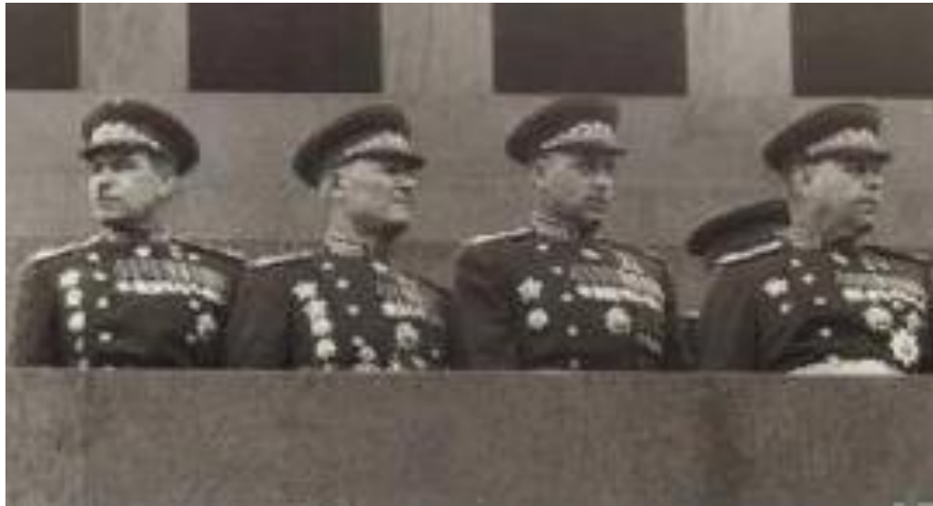
Маршалы Советского Союза (слева направо: Л.А. Говоров, И.С. Конев, К.К. Рокоссовский, А.М. Василевский) на трибуне мавзолея В.И. Ленина во время Парада Победы 24 июня 1945 г. СССР, Москва, 24 июня 1945 г.

Помимо Жукова, Василевского и Сталина, кавалерами высшего советского военного ордена стали (в порядке награждения) маршалы: командующий 2-м Белорусским фронтом К.К. Рокоссовский (30 марта 1945 г.) — за освобождение Польши, командующий 1-м Украинским фронтом И.С. Конев (30 марта 1945 г.) — за освобождение Польши и форсирование Одера, командующий 2-м Украинским фронтом Р.Я. Малиновский (26 апреля 1945 г.) — за освобождение территорий Венгрии и Австрии, командующий 3-м Украинским фронтом Ф.И. Толбухин (26 апреля 1945 г.) — за освобождение территорий Венгрии и Австрии, командующий Ленинградским фронтом Л.А. Говоров (31 мая 1945 г.) — за освобождение Прибалтики, представитель Ставки Верховного Главнокомандующего С.К. Тимошенко (4 июня 1945 г.) — за планирование боевых операций и координацию действий фронтов в течение всей войны, начальник Генерального штаба А.И. Антонов (генерал армии) (4 июня 1945 г.) — за планирование боевых операций и координацию действий фронтов в течение всей войны, командующий 1-м Дальневосточным фронтом К.А. Мерецков (8 сентября 1945 г.) — по итогам войны с Японией.