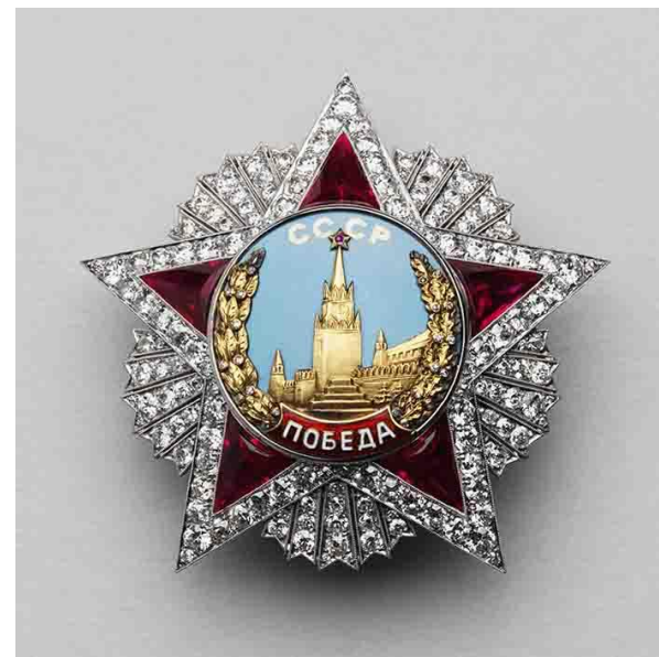
Ордена «Победа» маршалов Советского Союза И.В. Сталина, К.К. Рокоссовского, К.А. Мерецкова. СССР, Москва, 1943-1945 г. (ФГБУК «Государственный историко-культурный музей-заповедник «Московский Кремль»)