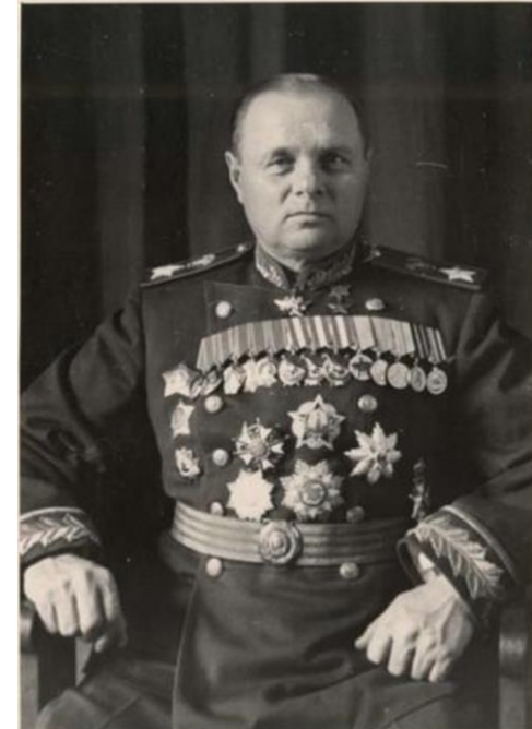
Фотопортрет маршала Кирилла Афанасьевича Мерецкого. СССР, 1960 г.