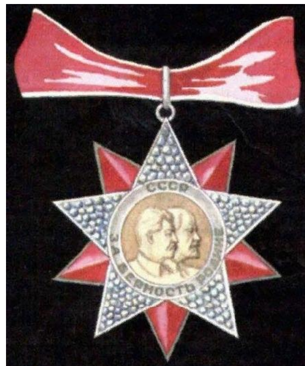
Эскизы ордена для награждения высшего командного состава Красной Армии. Художник А.И. Кузнецов (ФГБУ «ЦМВС РФ», филиал «Музей истории военной формы одежды»)