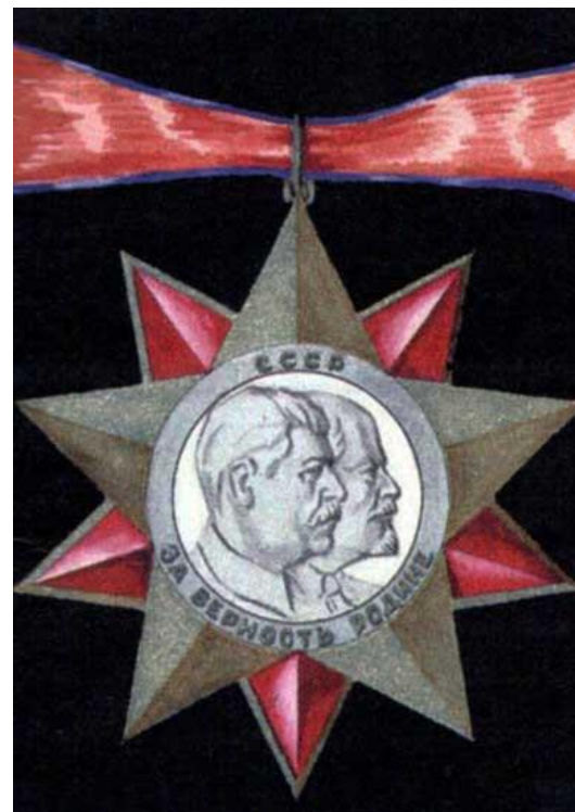
Эскиз ордена для награждения высшего командного состава Красной армии. Художник Н.С. Неёлов (ФГБУ «Центральный музей Вооруженных Сил Российской Федерации» (далее — ФГБУ «ЦМВС РФ»), филиал «Музей истории военной формы одежды»)