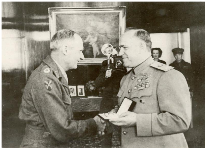
Маршал Советского Союза Г.К. Жуков вручает орден «Победа» фельдмаршалу Великобритании Б.Л. Монтгомери

Орденом «Победа» награждались и представители союзников СССР в годы Великой Отечественной войны. 5 июня 1945 г. по решению И.В. Сталина «за выдающиеся успехи в проведении боевых операций большого масштаба, в результате которых достигнута победа Объединенных Наций над гитлеровской Германией» были награждены два командующих союзными войсками: генерал армии США Дуайт Эйзенхауэр и британский фельдмаршал Бернанд Лоу Монтгомери. 6 июля 1945 г. король Румынии Михай I был награжден советским орденом «Победа» «за мужественный акт решительного поворота политики Румынии в сторону разрыва с гитлеровской Германией и союза с Объединёнными Нациями в момент, когда ещё не определилось ясно поражение Германии». 9 августа 1945 г. «За выдающиеся заслуги в деле организации вооружённых сил Польши и за успешное проведение боевых операций Войска Польского в решающих битвах против общего врага — гитлеровской Германии» был награжден Верховный главнокомандующий Войском Польским генерал Михал Роля-Жимерский. Последним из иностранных кавалеров ордена «Победы» стал Верховный Главнокомандующий Югославской Народно-освободительной Армией Маршал Югославии Иосип Броз Тито. 9 сентября 1945 г. он был награжден «за выдающиеся успехи в проведении боевых операций большого масштаба, способствующих достижению победы Объединённых Наций над гитлеровской Германией».