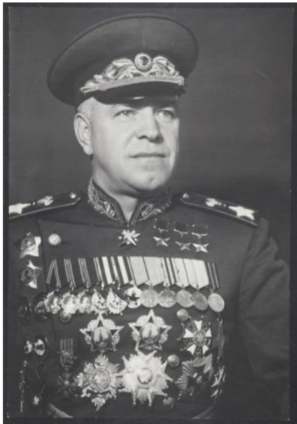
Маршал Советского Союза Г.К. Жуков. СССР, 1946 г.

10 апреля 1944 г. состоялись первые награждения полководческим орденом. Орден «Победа» № 1 получил командующий 1-м Украинским фронтом Маршал Советского Союза Георгий Константинович Жуков. Орден «Победа» № 2 получил начальник Генерального штаба Маршал Советского Союза Александр Михайлович Василевский. Оба они были награждены за освобождение Правобережной Украины. Позднее, Г.К. Жуков и А.М. Василевский стали кавалерами ордена «Победа» во второй раз: первый — «За умелое выполнение заданий Верховного Главнокомандования по руководству боевыми операциями большого масштаба, в результате которых достигнуты выдающиеся успехи в деле разгрома немецко-фашистских сил» (30 марта 1945 г.), второй — «За планирование боевых операций и координацию действий фронтов» (19 апреля 1945 г.).