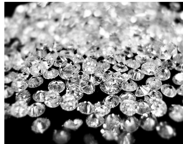
Драгоценные материалы, использованные при изготовлении орденов «Победа»: платина, золото, рубины, бриллианты