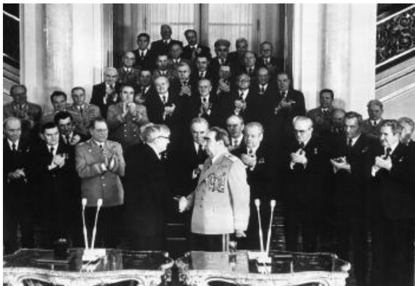
Вручение ордена «Победа» Генеральному секретарю ЦК КПСС, маршалу Советского Союза Л.И. Брежневу. СССР, Москва, 20 февраля 1978 г.

Последним, кто был награжден орденом «Победа», стал Генеральный секретарь ЦК КПСС, Председатель Президиума Верховного Совета СССР, Председатель Совета обороны СССР, маршал Советского Союза Леонид Ильич Брежнев. 20 февраля 1978 г. состоялась торжественная церемония вручения ордена «За большой вклад в победу советского народа и его Вооруженных Сил в Великой Отечественной войне, выдающиеся заслуги в укреплении обороноспособности страны, за разработку и последовательное осуществление внешней политики Советского государства, надежно обеспечивающей развитие страны в мирных условиях». В отличие от других, этот двадцатый по счету орден был сделан изначально не со штифтом с гайкой на обратной стороне, а с креплением булавочного типа. Мельхиоровая булавка была нужна для того, чтобы на торжественной церемонии быстро прикрепить орден на китель. Орден с винтовым креплением довольно сложно прикрепить к одежде. Поэтому во время войны награды вручали в коробке. До Л.И. Брежнева поменял штифтовое крепление на булавочное Б.Л. Монгомери. Уже во время перестройки в связи с тем, что награждение Брежнева было осуществлено с грубейшим нарушением статута ордена и с учетом огромного числа писем от возмущенных фронтовиков, Президиум Верховного Совета СССР 21 сентября 1989 г. отменил указ о его награждении.