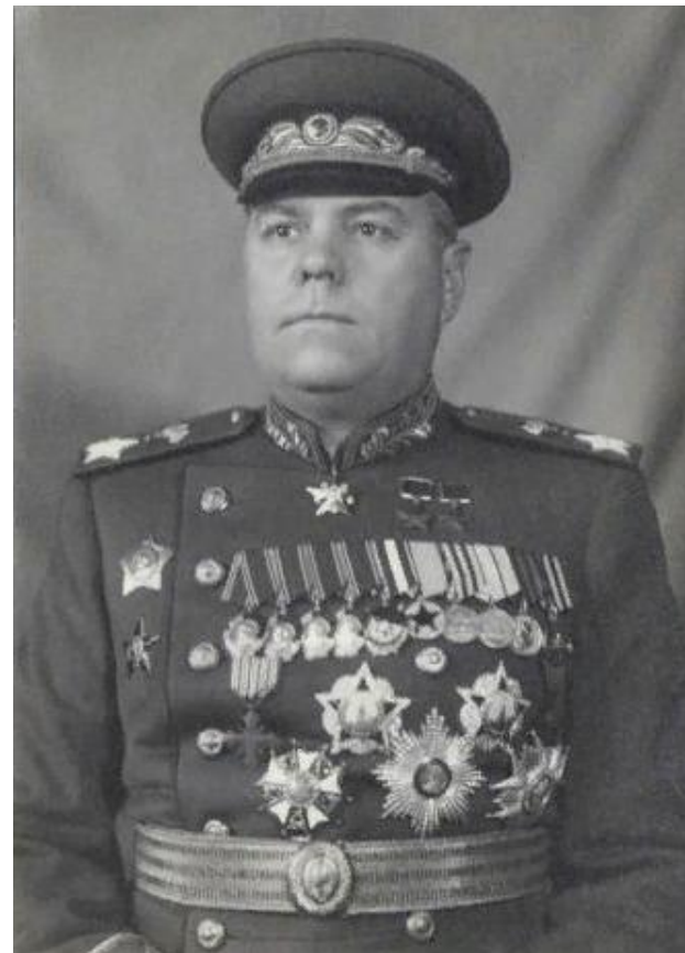
Маршал Советского Союза А.М. Василевский. СССР, после 1945 г.