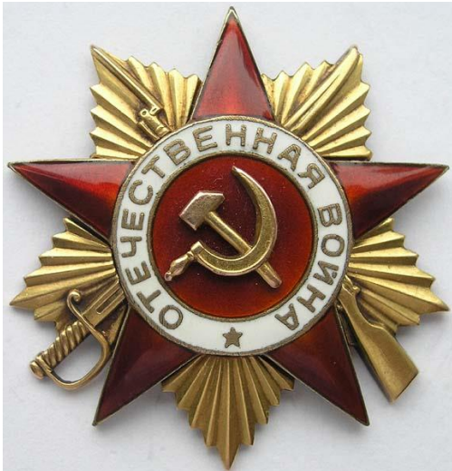
Орден Отечественной войны I степени