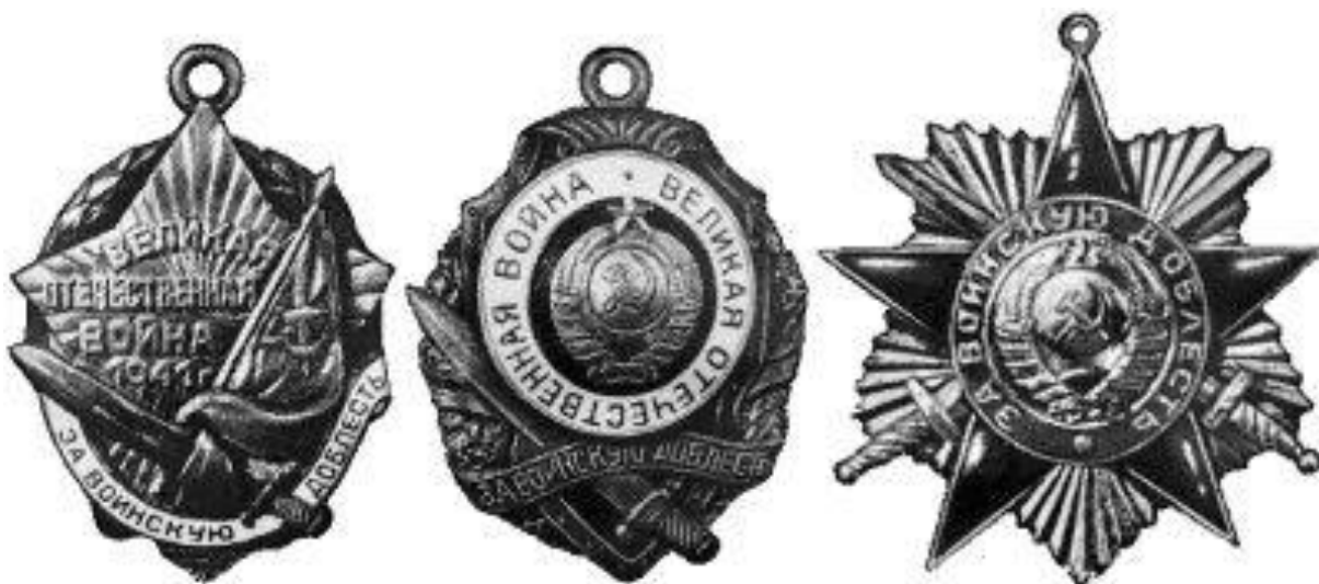
Проекты ордена Отечественной войны