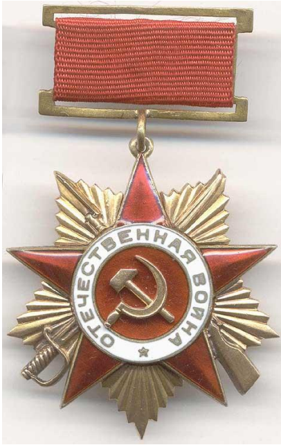
Орден Отечественной войны I степени