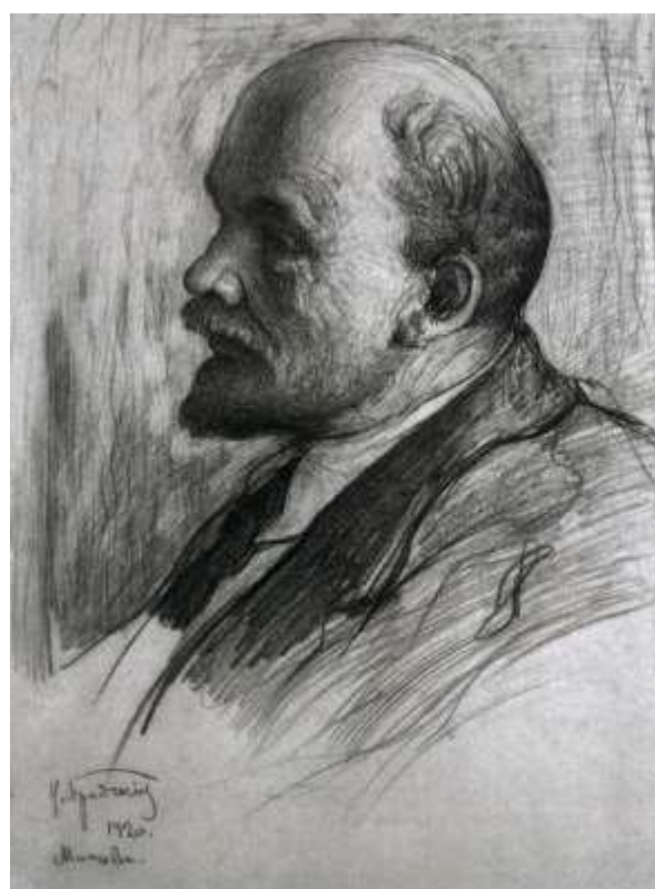
Рисунок И. Бродского 1920 г.